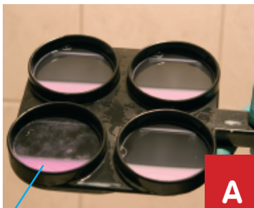
verdikking van de melk