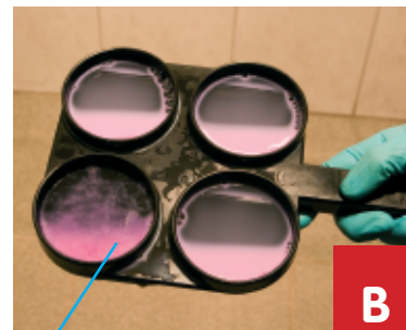
verslijming op de bodem