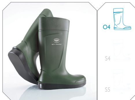
Agrilite® desinfect - ref.V2100/9180